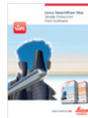
Leica SmartWorx Viva Catálogo de producto