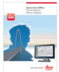
Leica Viva LGO Catálogo de producto