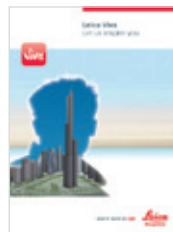
Leica Viva Catálogo general