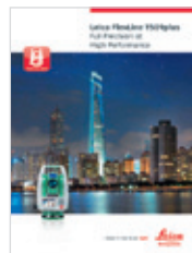
Leica FlexLine TS09plus Catálogo de producto

Las ilustraciones, descripciones, y datos técnicos no son vinculantes. Todos los derechos reservados. Impreso en Suiza – Copyright Leica Geosystems AG, Heerbrugg, Suiza, 2012. 781683es – VI.13 – galledia