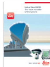
Leica Viva GNSS Catálogo de producto