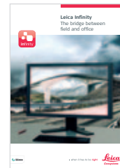
Leica Infinity Catálogo de Software