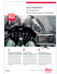
Leica MultiWorx Catálogo de Software